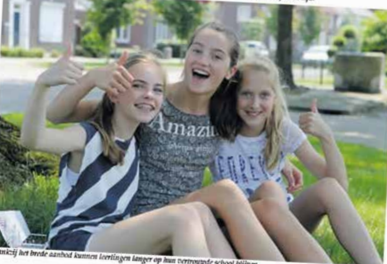
Dankzij het brede aanbod kunnen leerlingen langer op hun vertrouwde school blijven